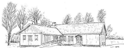
Bolmsö Bygdegård Sjöviken